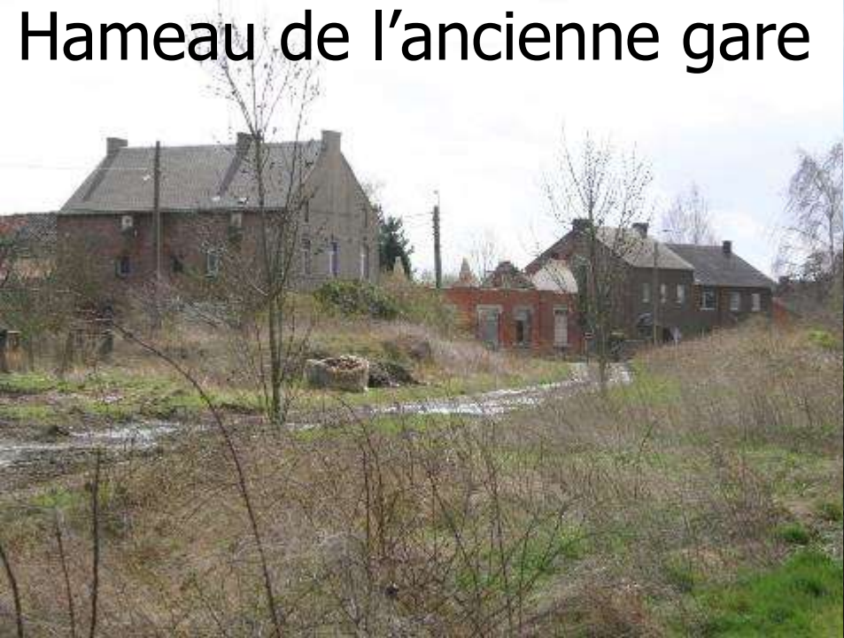
Hameau de l'ancienne gare