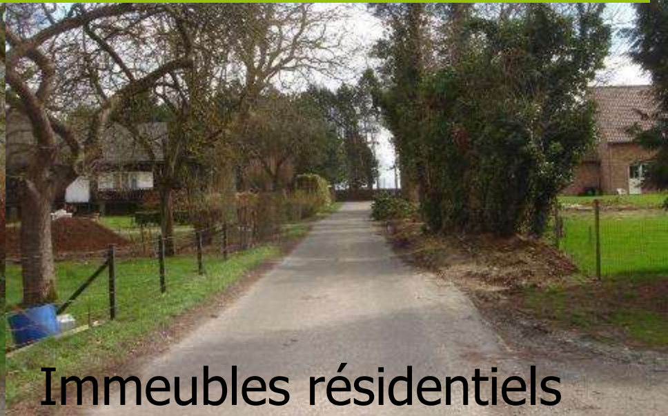
Immeubles résidentiels voisins