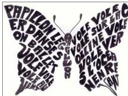
Papillon - Par les élèves de la CLIS de l'école de Brieux.